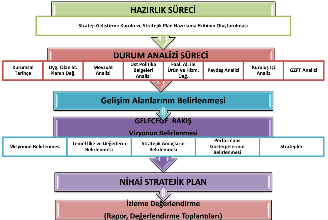
Şekil 1. Atatürk İlkokulu Stratejik Plan Hazırlama Modeli

Okulumuz Stratejik Plan Hazırlama Ekibi; 1 Müdür Yardımcısı başkanlığında, 5 Öğretmen, 3 öğrenci velisinden oluşturulmuştur.